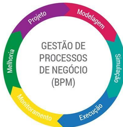
Figura 1. Ciclo do BPM (Dheka, 2017)

A Figura 1 representa o ciclo do BPM. O ciclo garante na prática, a forma gerencial de todas as etapas dos processos de negócio. Com ele é mais fácil de manter um controle de qualidade elevado, sendo que é possível analisar cada fase de forma simplificada, podendo encontrar erros que impedem a continuidade do ciclo.