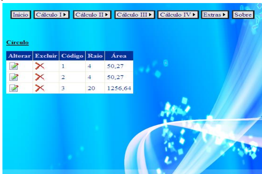
Figura 6: Tela de consulta referente à opção Extras do sistema.

Na opção Extras do sistema C.D.I., foram calculadas as áreas das principais figuras planas: círculo, losango, paralelogramo, quadrado, retângulo, trapézio e triângulo (Figura 6).