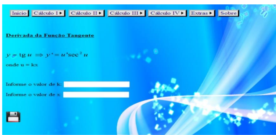
Figura 3: Tela de cadastro referente ao Cálculo II.

Em cada página de consulta, é exibida uma tabela com as informações cadastradas no banco de dados. Além disso, ao clicar no símbolo “Alterar”, a página é redirecionada para a página de cadastro, onde o usuário pode modificar os valores