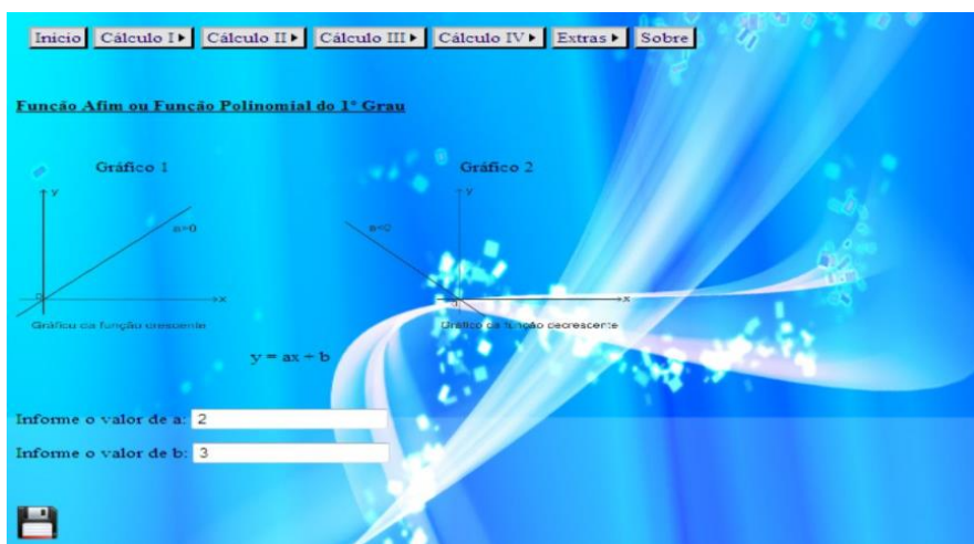
Figura 1: Tela de cadastro referente ao Cálculo I.

No Cálculo II, foi implementado no sistema os cálculos de limites (Figura 2) e derivadas (Figura 3) das funções: polinomial, exponencial, exponencial natural, logarítmica, logarítmica natural, seno, cosseno, tangente, cotangente, secante e cossecante.