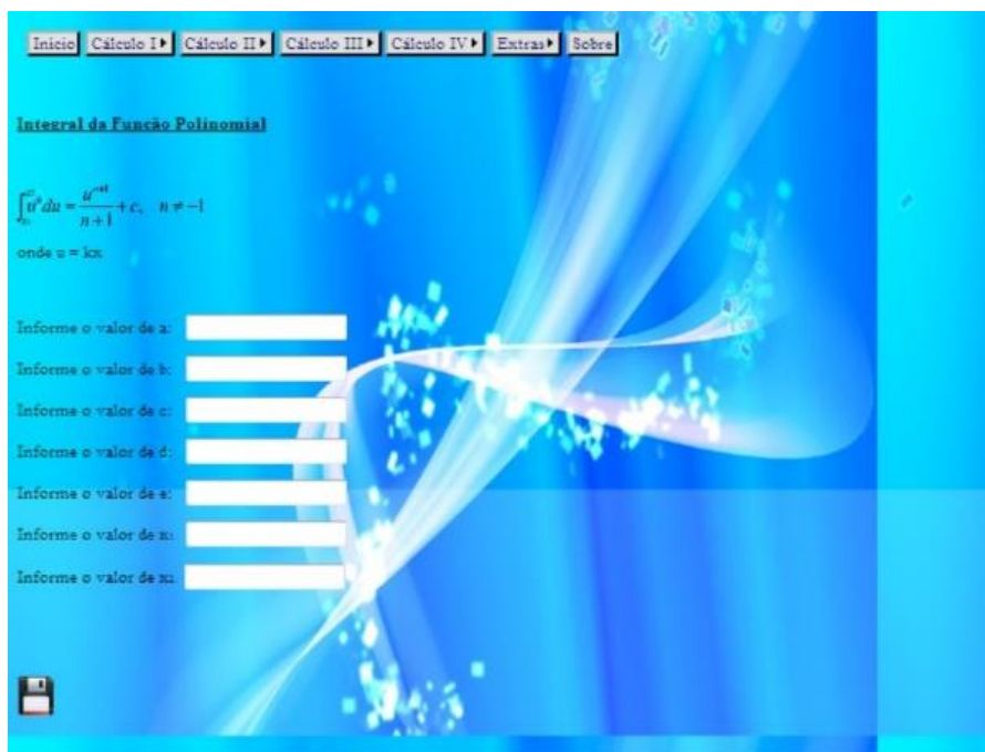
Figura 4: Tela de cadastro referente ao Cálculo III.

No Cálculo III, foram realizados os cálculos para determinar integrais definidas e indefinidas das funções: constante, polinomial, exponencial, exponencial natural, logarítmica, seno, cosseno, tangente, cotangente, secante e cossecante (Figura 4).