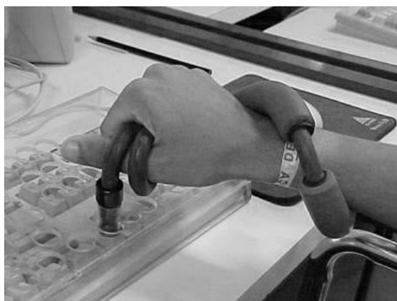
Figura 1. Estabilizador de punho e abdutor de polegar

Neste tipo de tecnologia se enquadram todas que podem oferecer recursos e/ou serviços que possam propiciar maior amplitude das habilidades deficientes no PNE (Figura 1), visando assim, uma vida de maior autonomia, independência e inclusão, mas sempre respeitando suas especificidades. Um exemplo de recurso que se enquadra em tecnologia assistiva na informática podem ser vistos na figura 1 abaixo: