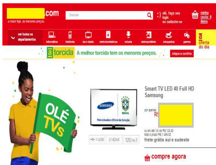
Figura 1 – Homepage do Sistema A

Foram escolhidos dois sistemas de compras eletrônicas para serem avaliados. Por questões acadêmicas serão ocultados os nomes dos sistemas, sendo disponibilizadas apenas imagens da homepage dos sistemas.