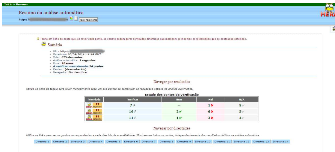
Figura 6 – Resultados de Testes realizados com o Sistema B utilizando a ferramenta Hera.

O Sistema B também foi analisado com as ferramentas Hera e Examinator apresentando os seguintes resultados: